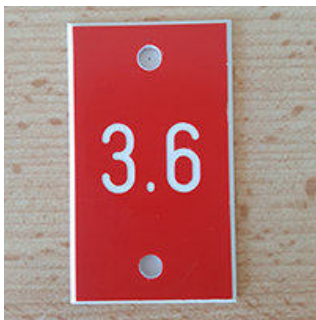
Nummernschild 30 × 50 mm