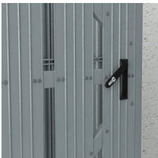
Schwenkriegelschloss mit versenkbarem Türgriff für Profilzylinder