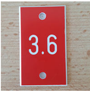
Nummernschild 30 × 50 mm