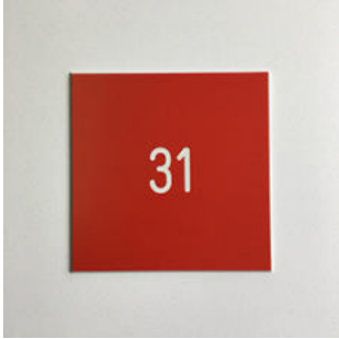
Nummernschild 100 × 100 mm

Das Trennwandsystem LO ist lieferbar mit folgenden Zubehörteilen: